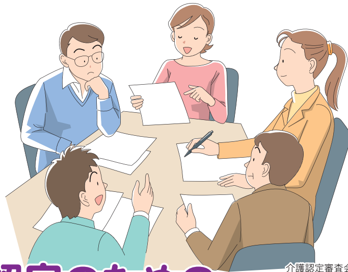
介護認定審査会は、保健・医療・福祉の専門家による第三者機関です。